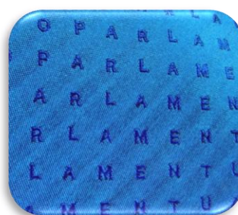
Jacquard en el mismo color